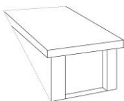
Lucarne à un pan de toit soulevé