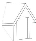
Lucarne à deux pans